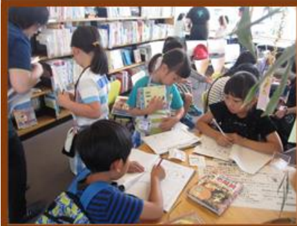
最後は、今日やったことをまとめて終わります。