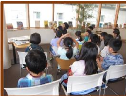
最初に『としょかんへいこう』(斉藤洋/作、田中六大/絵)を読んでから・・・

ひろばの名前を覚えたり、自分があまり利用しないひろばにも、いろいろな子ども向けの本があることを知り、より図書館や本に興味を広げてもらえたようでした。