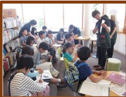
図書館の各エリアの名前をクイズ形式で学びます。