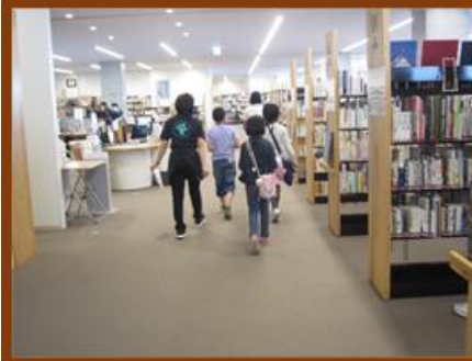
それぞれ、本の「所在確認票」を持って、グループごとに館内へ出発！