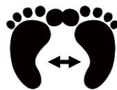
／ グーの あし ／

て 手だけじゃなくて、足でもできるよ！ あし ちょっ と むずかしいけど て あし とあし 同時にやってみても おもしろいよ！