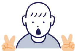
① りょうてで チョキをします