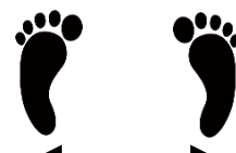
／ パーの あし ／