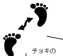
／ チョキの あし ／